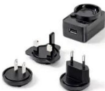
Power Adapter x2