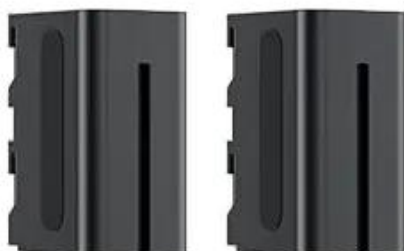
Battery 4400Mah x2