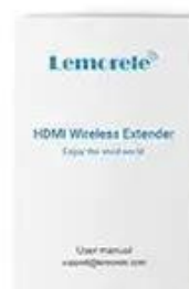
User Manual x1