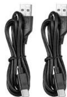
USB C Cable x2