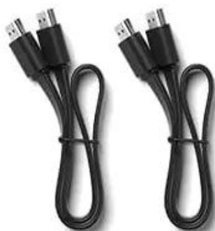
HDMI Cable x2