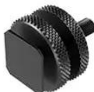
Cold Shoe x1