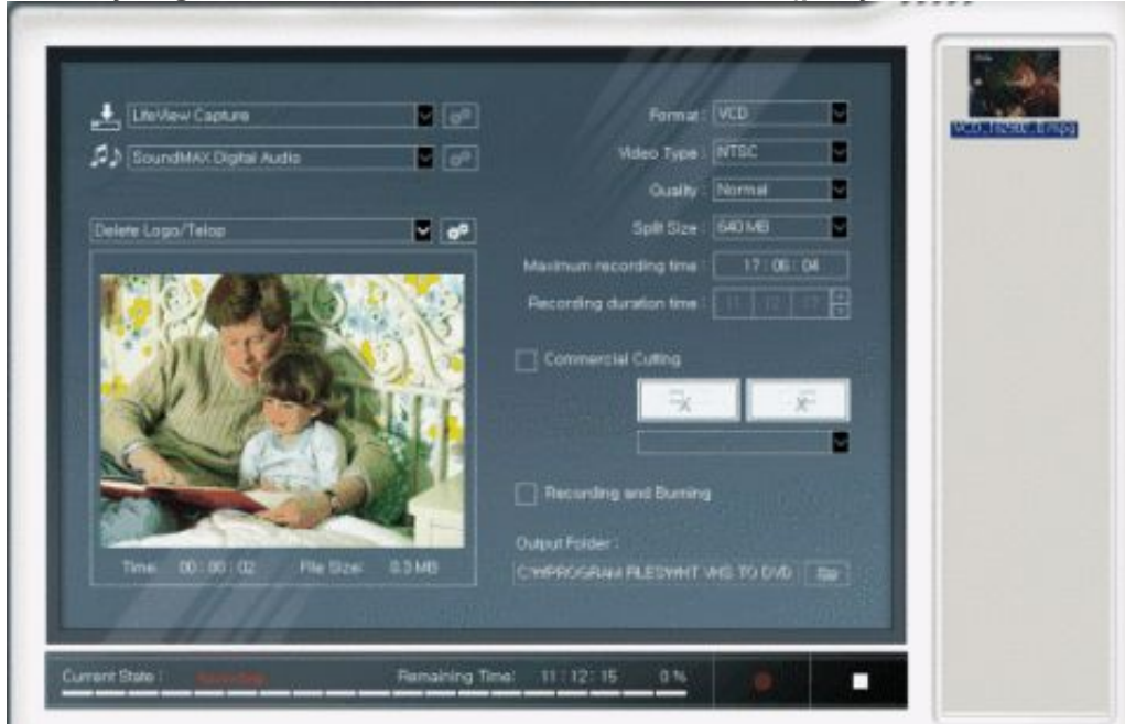
Video Grabber VG0001A firmy

Produkcja tego modelu została zakończona. Został on zastąpiony modelem VG0030.