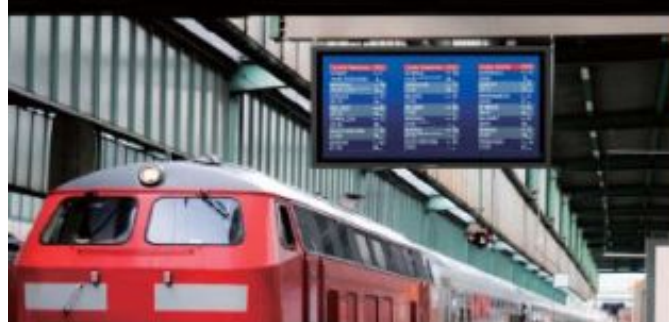
Podłączenie do wielu wyświetlaczy