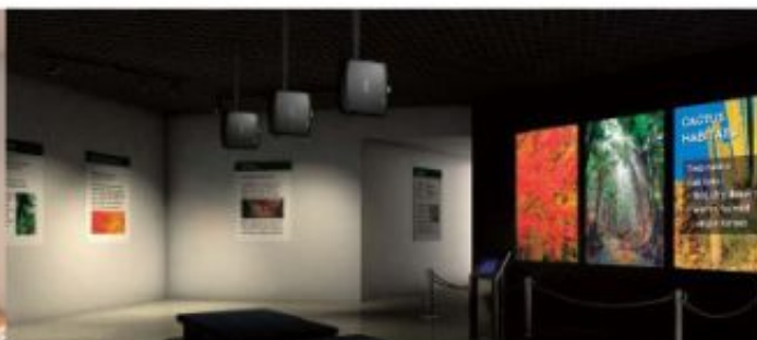
Podłączenie do istniejącej instalacji i wielu odbiorników