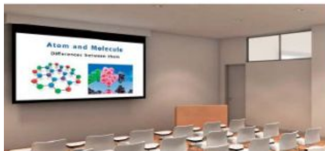
Podłączenie do nowego systemu

Kompatybilny ze wszystkimi rodzajami istniejącego lub nowego systemu, elastyczny montaż i integracja