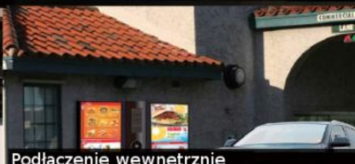
Podłączenie wewnętrznie umieszczonego PC do zewnętrznych wyświetlaczy